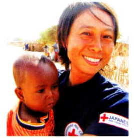
国際救援活動 82,707千円