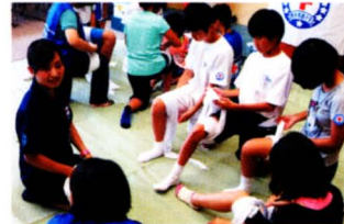
青少年赤十字活動 36,514千円