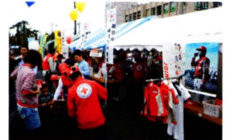
各市区町村での赤十字活動 67,973千円