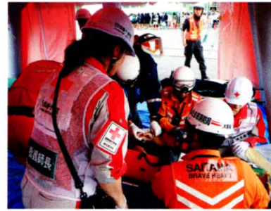
災害救護活動 104,557千円