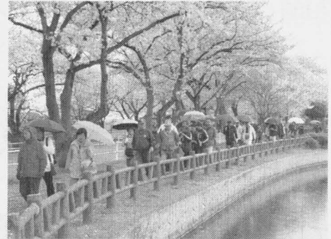
和土住宅水上公園にて

しました。予定された城址公園周辺までのコースを主催者の判断で急遽変更して、和土住宅近辺を周遊することになりました。浮谷経由和土小学校を経て、和土住宅水上公園で休憩。普段は気が付かないが桜の大木があちこちで満開の花を咲かせており、目を楽しませてくれました。南病院、しらさぎホーム、城南小学校を経て柏崎小学校まで約7Kmの行程でした。戻ってきたら体育振興会の皆さんがつくった暖かいトン汁が用意されており、冷えた体にうれしい一杯でした。