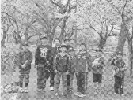
かしわガッツボーイズの少年達

小雨交じりの花冷えの日でしたが柏崎小学校に110名が集合、かしわガッツボーイズ（野球）の皆さんも参加