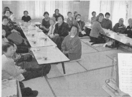
聞き惚れる皆さん

5人の奏者による美しいオカリナの音色は30名の参加者を魅了、聞き惚れてしまいました。10数曲の演奏の後、オカリナの伴奏でみんな合唱、大きな歌