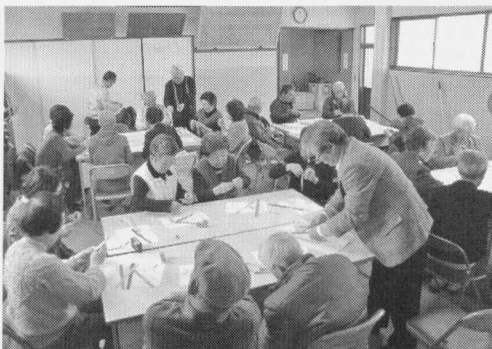
コマ作り、結構難しいね！