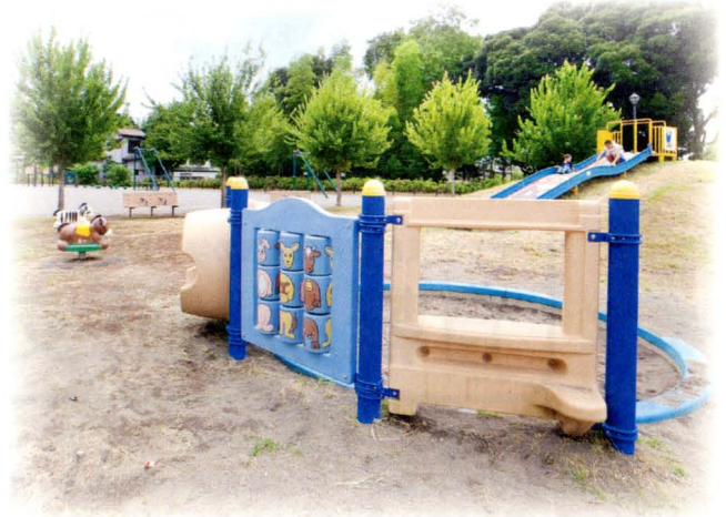
▲太田窪四丁目公園