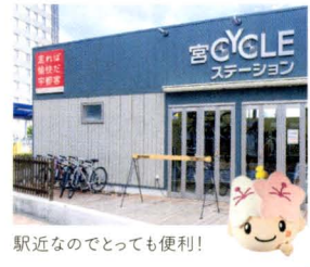
駅近なのでとっても便利!

JR宇都宮駅西口にある市営駐輪場で電動アシスト自転車などの貸し出しを行っています。その隣にある「宮サイクルステーション」ではロードバイクを借りることもでき、特に休日にはサイクルスポーツのファンでにぎわいます。