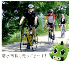
清水市長も走ってま〜す!

昨年策定された整備計画をもとに、自転車だけでなく歩行者の安全性も高まるまちづくりを進めています。これまでに約20kmの走行空間が整えられ、平成35年度までに合計約200kmの自転車通行環境を整備します。