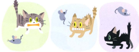
なわばりをつくって別々にくらす