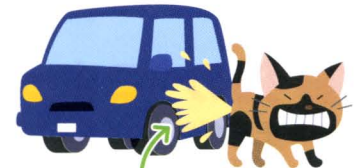
この尿はすごくくさい スプレー尿