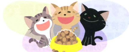
ひとつの場所にあつまってくる