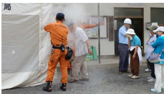
7/2 第1回防災訓練(煙体験)