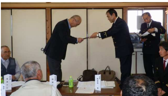
7/2 第1回防災訓練(煙体験)