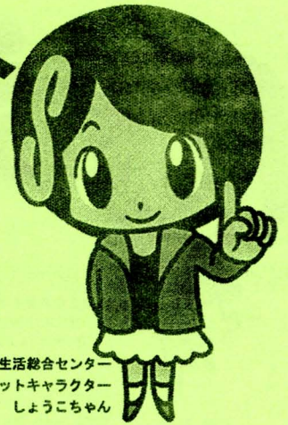
さいたま市消費生活総合センター マスコットキャラクター さいたま しょうこちゃん

消費生活センターでは、商品やサービスの契約トラブルなど、消費生活に関する相談を受け付け、消費生活相談員が相談者の皆さんと共に考え、解決に向けてお手伝いします。