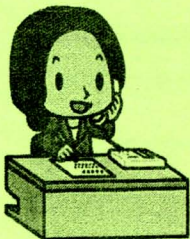
さいたま市消費生活総合センター マスコットキャラクター 相談員さん