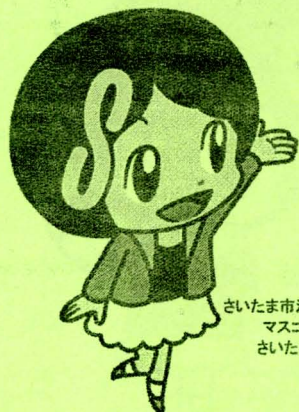
さいたま市消費生活総合センター マスコットキャラクター さいたま しょうこちゃん