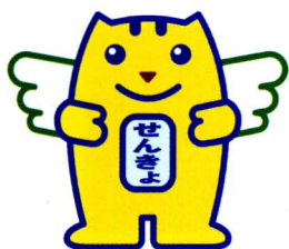
選挙のめいすいくん

全国で約8万人、さいたま市では約1,100の方が参加している民間の団体です。自主的に参加された方、自治会から推薦された方、学識経験者、青年団体の代表者、女性団体の代表者、報道関係者、教育関係者などが参加し、明るい選挙推進運動を実施しています。