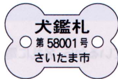
さいたま市の犬鑑札(実物大)

全国では、飼い主不明の犬が少なくとも 1万頭 殺処分されました。 ほとんどは、鑑札がついていれば助かった命です。 (平成27年度 環境省まとめ)