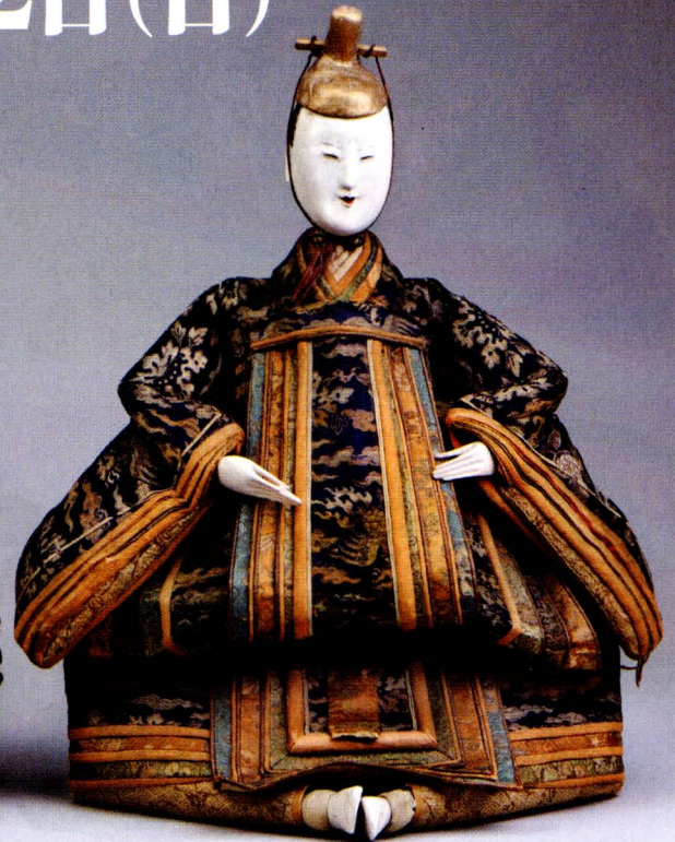
「享保雛(さいたま市所蔵 笛歌コレクション)」