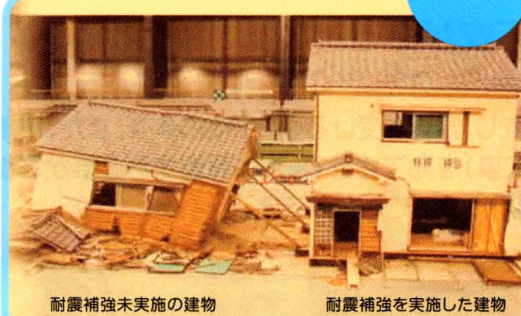
耐震補強未実施の建物