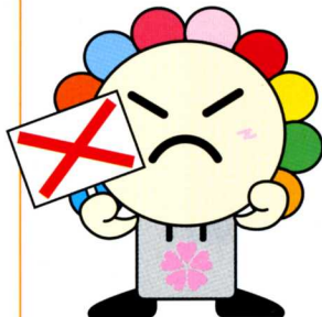
さいたま市選挙キャラクター みらいクン