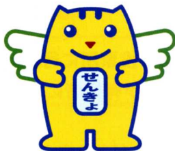
選挙のめいすいくん

全国で約8万人、さいたま市では約1,100の方が参加している民間の団体です。自主的に参加された方、自治会から推薦された方、学識経験者、青年団体の代表者、女性団体の代表者、報道関係者、教育関係者などが参加し、明るい選挙推進運動を実施しています。