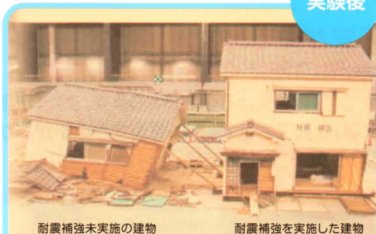
耐震補強未実施の建物