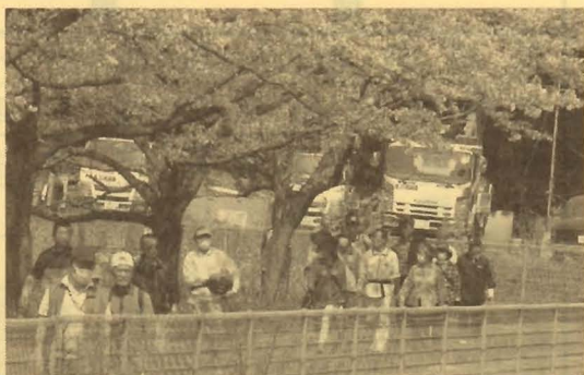
見沼代用水東縁の桜並木に沿って

さぎ山記念公園はかつて江戸時代から“野田のさぎ山”として知られ、国の天然記念物に指定されていたことを後世に残すため整備された公園です。ここからは田園風景の中、小学校を目指してひと踏ん張り、11時半ごろには全員帰着。体育振興会のみなさん手造りの“おにぎり、トン汁”でお腹を満たしました。