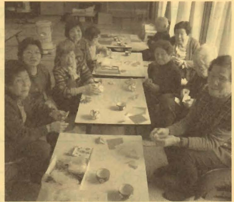
制作途中で一休み

昼食後、包括センターから3名が来場、“百歳健康体操”と言う運動を指導して頂きました。日頃の運動不足を解消し長生きできるようにと、皆で体をほぐしました。続ける事が重要です。