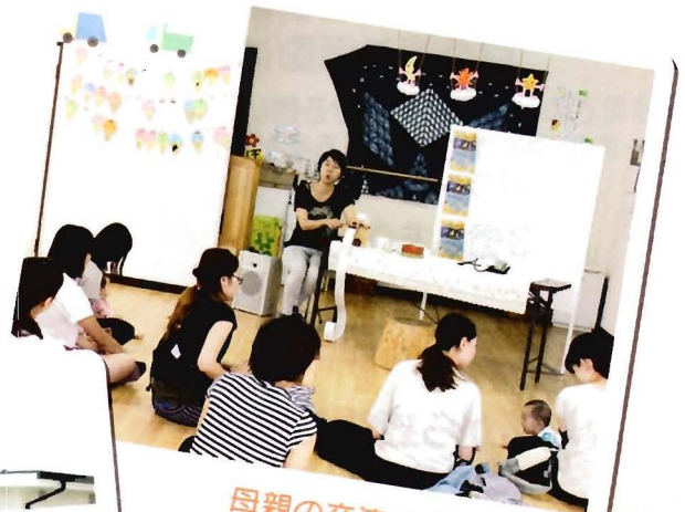
母親の交流の場に 子ども文化ステーション