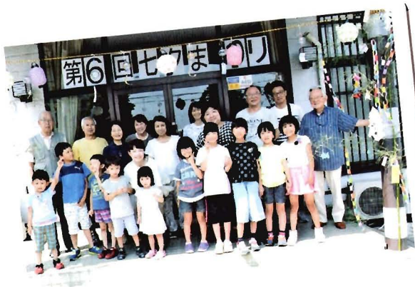
世代間文化交流事業に プロムナードあんしん福祉ネットワーク