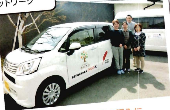
相談支援に使う車の購入に 社会福祉法人春の木会