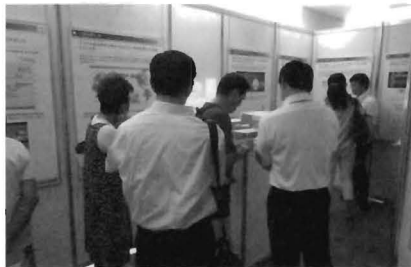
※これまでの説明会の様子

この度、更なる情報提供を行うため、フェーズ5の住民説明会を開催することといたしましたのでお知らせします。多くの皆様のご来場をお待ちしております。