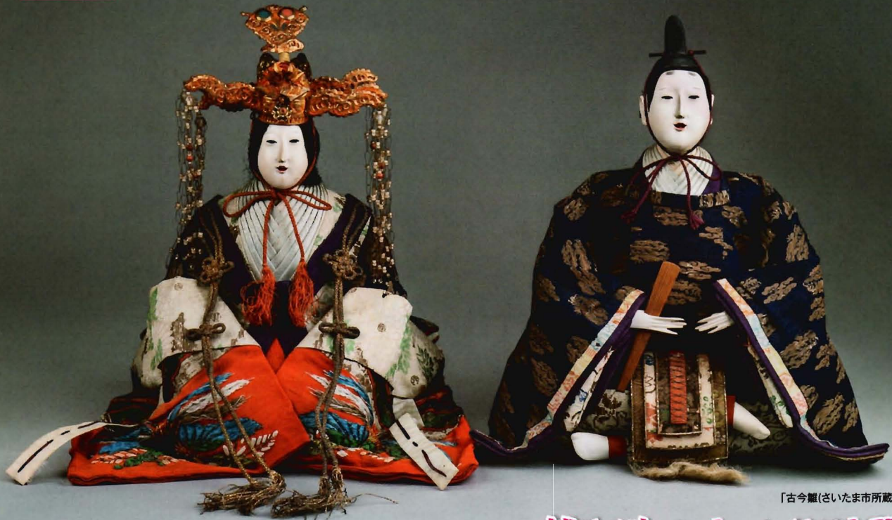
「古今雛(さいたま市所蔵)」