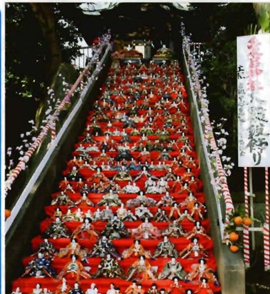
愛宕神社 大雛段飾り