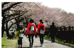
見沼たんぼでの農作業体験学習 さいたまーチ 見沼ソーデウォーク