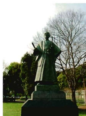
見沼代用水を築いた 井沢弥惣兵衛為永の銅像

改めて歴史をおさらいしてから見沼たんぼを歩けば、また違った景色が見えてくるかもしれません。