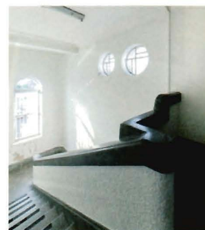
▲アーチ状の造形やアール・デコ調の装飾が随所に施された館内。

外観は装飾性の少ない合理主義様式のシンプルなデザインですが、内部はアーチ状の窓や丸い柱、曲線を用いた天井の梁など、昭和初期の洋風建築の特徴が見られ、2017年には国の有形文化財にも登録されました。