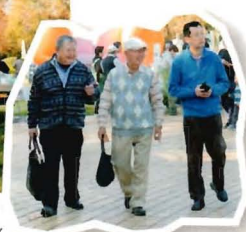
korekara読者モニターの皆さん