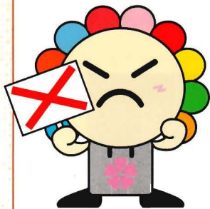
さいたま市選挙キャラクター みらいくん