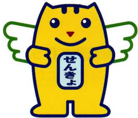
選挙のめいすいくん

全国で約8万人、さいたま市では約1,100人の方が参加している民間の団体です。自主的に参加された方、自治会から推薦された方、学識経験者、青年団体の代表者、報道関係者などが参加し、明るい選挙推進運動を実施しています。