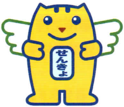
選挙のめいすいくん

全国で約8万人、さいたま市では約1,100人の方が参加している民間の団体です。自主的に参加された方、自治会から推薦された方、学識経験者、青年団体の代表者、報道関係者などが参加し、選挙管理委員会と協力して、明るい選挙推進運動を実施しています。