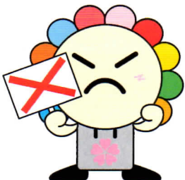
さいたま市選挙キャラクター みらいくん