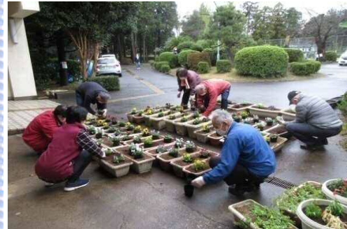
みなさん手際よく集中して作業しています。

11月9日パソコンボランティアさんにご協力いただき、公民館玄関先のプランター花壇の入れ替え作業を行いました。当日はそれまで降っていた雨も上がり、みなさん手際よく、3種類(パンジー・ビオラ・葉ボタン)の花の苗を移植して頂きました。来館する方々に花パワーと魅力を伝えたいですね!