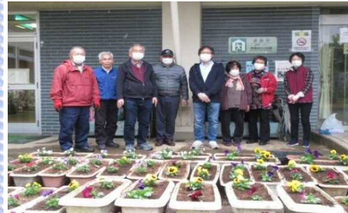
パソコンボランティアの皆さんお疲れ様でした。

公民館では、利用されるみなさんをお迎えし、元気に活動して頂くために、毎年2回を目標に草花の入れ替えや除草作業等行っています。