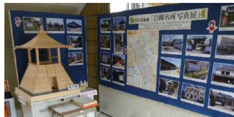
市民の日事業「岩槻名所写真展」 ●令和3年5月上旬～10月上旬