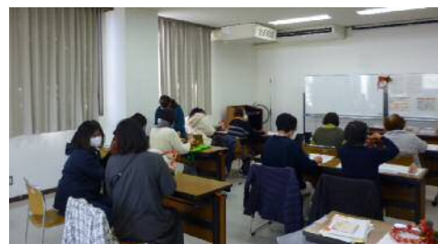
お正月飾りづくり教室 ●令和3年12月15日