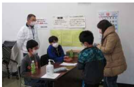
受付、小学生のお手伝い、会場 の設営に片付けと、大活躍の 中学生ボランティアの 二人です。