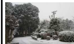
1月6日 午後の風景 (雪が舞う 公民館の庭)

1月6日(木)の雪は思った以上に降り積もって驚きました。公民館周辺も暫しの間、一面の銀世界となりました。