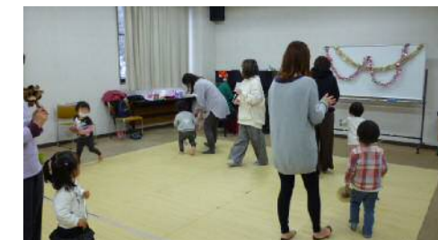
ひよこクラブ③親子英語リトミック ●令和3年12月17日