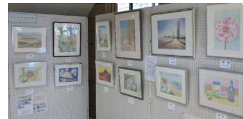
らくがきクラブ ●令和3年11月12日～12月10日