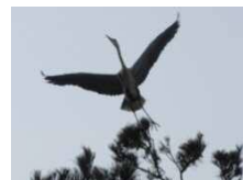
巣から勢いよく飛び立つアオサギ

1月下旬に1組のアオサギのつがいがやってきました。例年、公民館事務室から見て一番奥の木で子育てしているアオサギですが、今年はかなり手前の木に営巣しています。シラサギも徐々にやってきて賑わいを増す季節となり、陣取り合戦も間もなく始まりそうです。