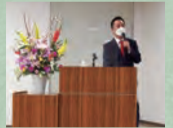
村井内閣総理大臣補佐官の講演