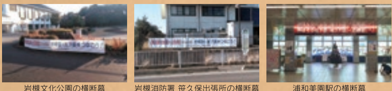
岩槻文化公園の横断幕

※さいたま市の事業に協力するため、一時的に別事業のPRに差し変わる期間がございます。