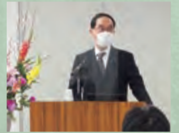
大野埼玉県知事の講演