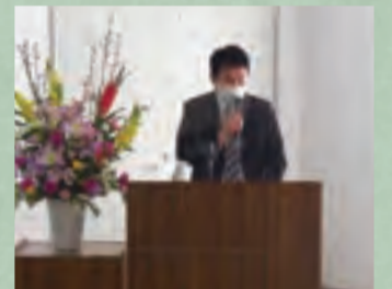
清水さいたま市長の講演