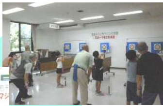
スポーツ吹き矢教室