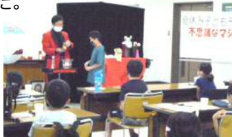
マジック体験教室