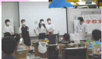
「科学教室」 中学生 ボランティア