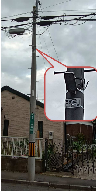
歩道側に追加設置