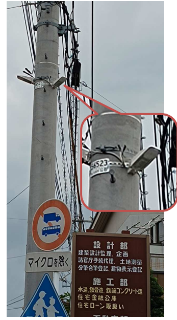
横断歩道側に追加設置