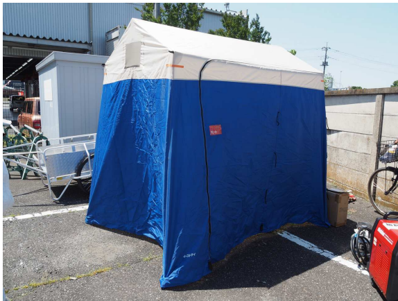
組立式簡易トイレ