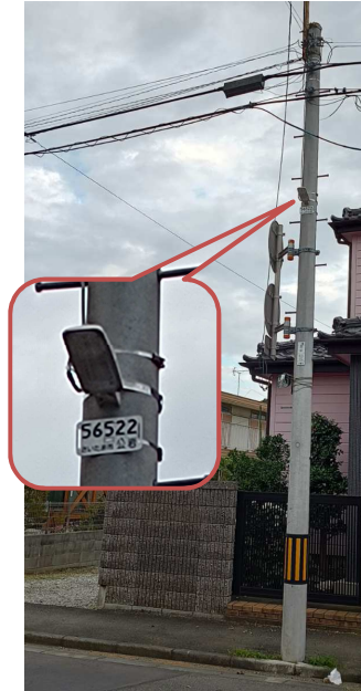
歩道側に追加設置