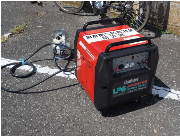
L P ガスエンジン発電機