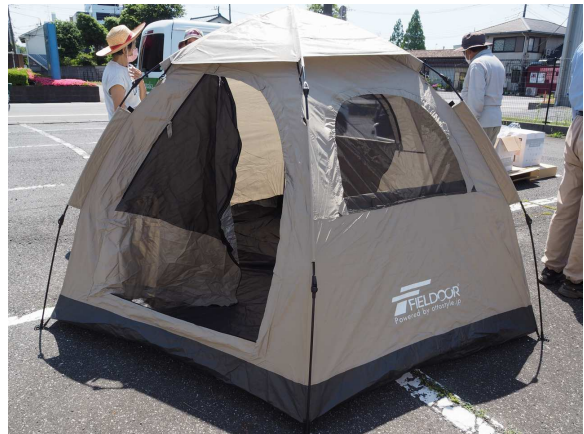
ワンタッチテント