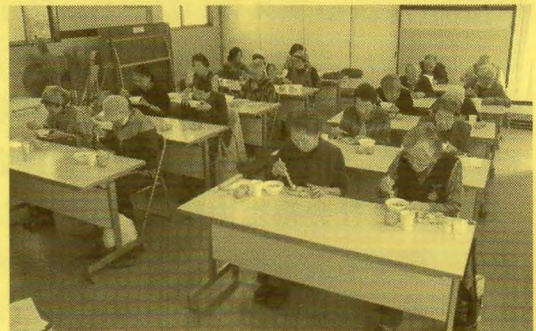
令和 4 年 11 月 8 日(火)

②令和 4 年 11 月 8 日(火) 小春日和の気持ち良い日でした。加倉 1 区のサロンは年 3 回行っています。今日は令和 4 年最後のサロンです。恒例の誕生日の方にプレゼントを贈りお祝い。今日はビンゴゲームで一喜一憂し景品をもらった人はうれし顔。さて、“昼食は手作りを頂く”という 1 区の伝統もコロナで中止されていましたが、久々に有志により早くからの準備、料理により具だくさんの味噌汁つきで混ぜご飯を頂きました。時節柄食事での会話は禁止、全員前を向いて黙々と・・・子供のころを思い出すネ！との感想も。最後に「なつかしの歌声広場」を皆で合唱しました。