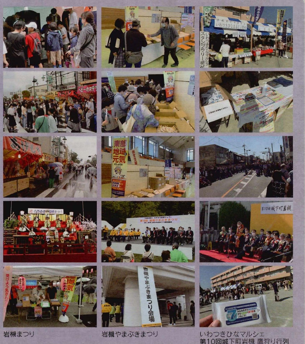
岩槻まつり 岩槻やまぶきまつり いわつきひなマルシェ 第10回城下町岩槻 鷹狩り行列

地下7期成会では、浦和美園駅～岩槻駅間の地下鉄7号線延伸実現に向けての啓発活動の一環として、延伸線地域の自然や歴史等の魅力、期成会オリジナル情報を掲載した散策マップを作成しています。東京五輪2020競技大会をはじめ各種国際・世界大会の開催を見据え、外国人観光客への散策マップを作成しています。また、本オリジナルマップは、延伸地域の魅力PRや円滑なコミュニケーションを図ることを目的に、ピクトグラム(絵文字)入りで、日本語と英語を併記し、かつて浦和美園駅～岩槻駅地域を運行していた旧武州鉄道の痕跡を辿りながら、見沼田んぼと元荒川の自然あふれる水辺と歴史を満喫頂けるコースをご紹介します。(ご希望の方は、期成会事務局にご連絡下さい)