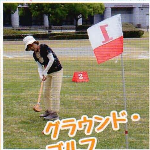
グラウンド・ゴルフ