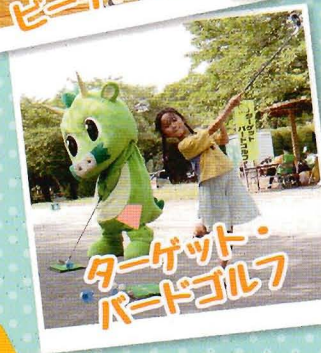
ターゲット・バードゴルフ